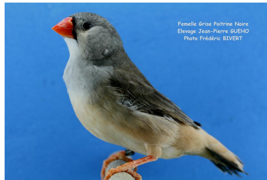
Femelle Grise Poitrine Noire Elevage Jean-Pierre GUEHO